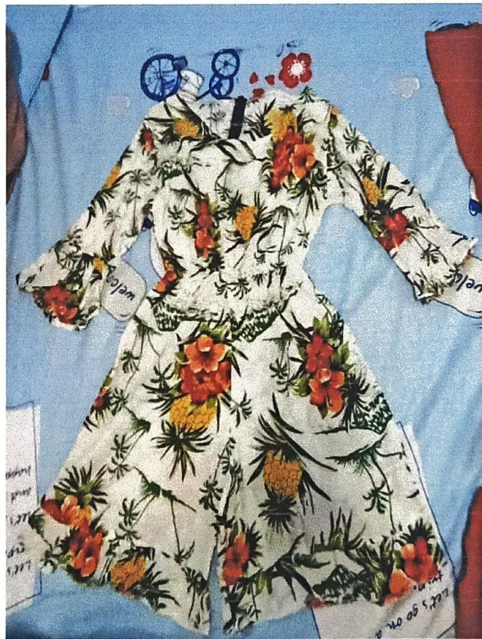
ภาพสินค้าและการขายเสื้อผ้าออนไลน์